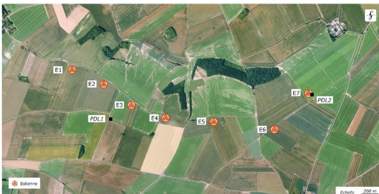
Localisation du projet (page 5 de l'étude d'impact)

Le modèle n'est pas encore choisi (page 9 de l'étude d'impact), l'avis est rendu sur un projet de 7 éoliennes d'une hauteur maximale de 178,5 m et de garde au sol d'au moins 58 m, et de deux postes de livraison localisées comme indiqué ci-dessous.